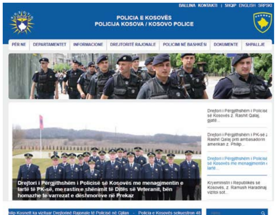
Figura 1: Ueb faqja zyrtare e Policisë së Kosovës

Duke marrë parasysh që ueb faqja është një aset mjaft i rëndësishëm i një organizate në zhvillimin dhe ngritjen e imazhit të saj, ne jemi përkushtuar që zhvillimi dhe ngritja profesionale të pasqyrojë në ngritjen dhe zhvillimin e Policisë së Kosovës në përgjithësi. Gjatë vitit 2018 është krijuar një 'grup punues', i cili grup ka punuar në