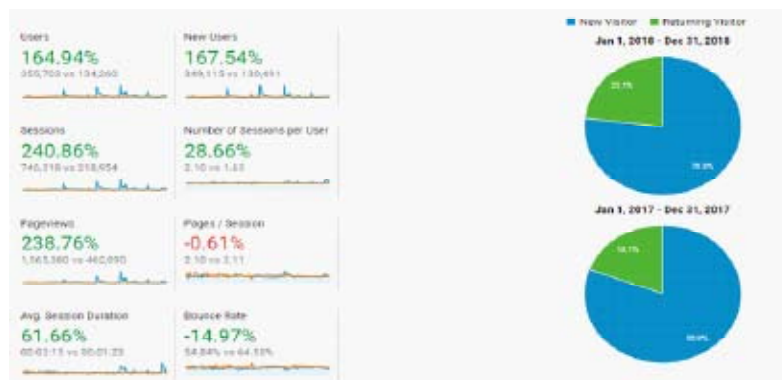
Figura 2. Statistikat e vizitave gjatë vitit 2018 në ueb faqen e PK-së

specifikat teknike të zhvillimit të një ueb faqe të re profesionale dhe të sigurt që do t'i plotësojë nevojat dhe të pasqyrojë zhvillimin e Policisë së Kosovës. Gjatë vitit 2018 ka pasur ngritje të vizitave (klikimeve) në ueb faqen zyrtare të Policisë së Kosovës (www.kosovopolice.com), shprehur në përqindje 164.94% më shumë se në vitin 2017. Numri i vizitave sipas përdoruesve gjatë vitit 2018 ka qenë 355 703 krahasuar me vitin paraprak 2017 që ka pasur 134 260. Kurse nëse bëjmë krahasimin në 'Pageviews' atëherë kjo përqindje është edhe më e lartë 238.76%